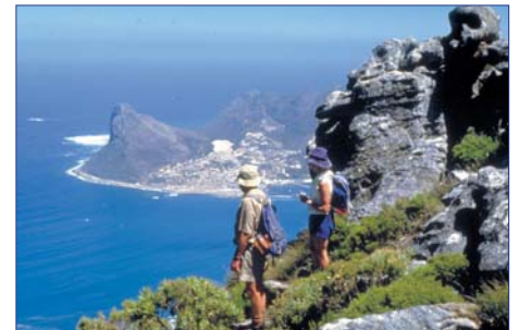
Hout Bay bei Kapstadt