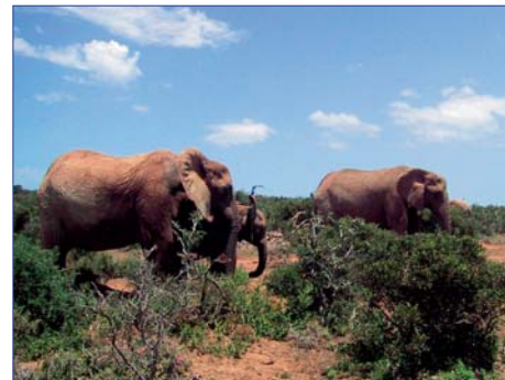
Addo Elephant Park

Hier hatten sich gegen Ende des 19. Jh. die letzten der ehemals zahlreichen Elefanten der Kapprovins zurückgezogen. Zu ihrem Schutz wurde 1931 der Nationalpark gegründet. Auf einer Pirschfahrt sehen Sie mit etwas Glück neben Elefanten auch Spitzmaulnashörner und Büffel.