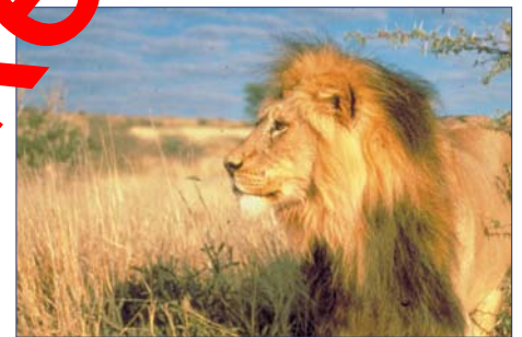
Im Krüger Nationalpark

„Eine einer unvergesslichen Traumreise!“