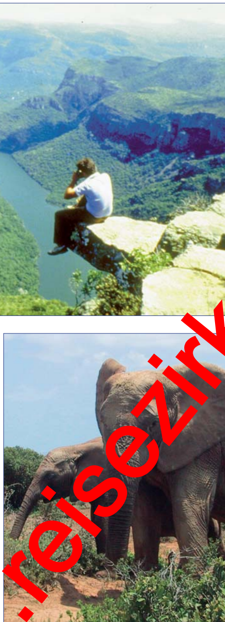
Im Krüger Nationalpark

8. Tag: KAPSTADT Heute steht ein Ganztagesausflug zur Kap-Halbinsel auf dem Programm. Es geht in das Fischerdorf Hout Bay, wo Sie kurz anhalten. Von dort aus fahren Sie in das Naturreservat des Kaps. Genießen Sie bei Ihrem Aufenthalt den Ausblick auf die Stelle, von der