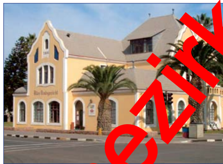
Swakopmund, Altes Amtshaus

steinerten Wald. Hier sind von urzeitlichen Fluten bis zu 30 Meter lange Baumstämme angeschwemmt worden und im Laufe der Jahrtausende versteinert. Das Alter dieser fossilen Baumstämme wird auf 200 Millionen Jahre geschätzt.